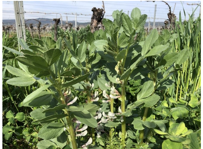
Abbildung 1: Üppige Gründüngung im Frühjahr – Ackerbohne im Gemenge mit Inkarnatklée, Wicke und Roggen

Im Landhandel findet sich mittlerweile eine Vielzahl fertiger Begrünungsmischungen, sowohl für „klassische“, Herbst-/Winterbegrünungen („Nitratfänger“, „Nitratzehrer“) wie auch für überjährige Begrünungsmischungen. Empfehlenswert sind insbesondere der Weinbaumix der Raiffeisen und die aus dem Ackerbau stammende Mischung „Cool Season“ der DSV-Saaten. Auch Klassiker wie ein Gemenge aus Wicke und Roggen sind hinsichtlich Bodenaufbau und Stickstoffanreicherung sehr zu empfehlen. Vor allem auf leichten Standorten kann ein hoher Anteil an nicht abfrierenden Leguminosen (z.B. Ackerbohne, Winterwicke, Inkarnatklée) empfehlenswert sein (siehe Abbildung). Nach dem Umbruch im Frühjahr kann der aus der Luft gebundene Stickstoff für die Reben verfügbar gemacht werden und häufig weitere Düngemaßnahmen ersetzen.