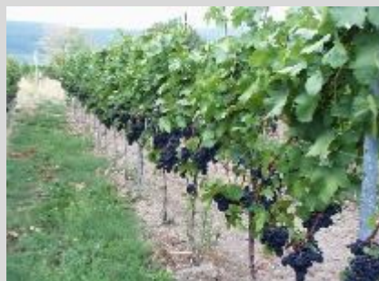
Abbildung 3: Moderat entblätterte Traubenzone, niedrig gehaltene Begrünung