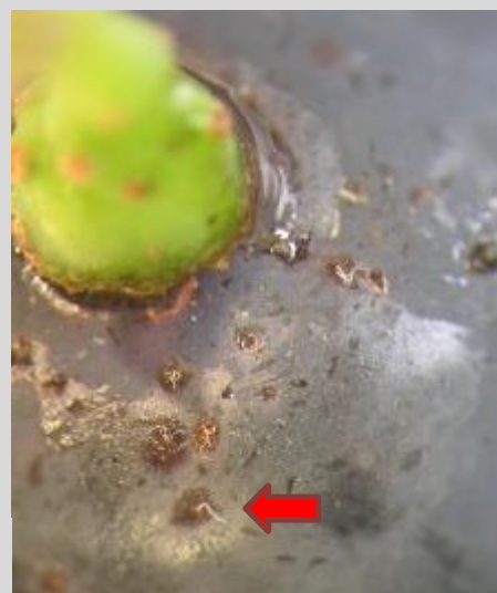
Abbildung 8: Mehrfach abgelegte Eier; weiße Atemanhänge sind auf der Beerenoberfläche sichtbar

Erst nachdem ein Befall festgestellt wurde, sollte eine Abwägung zwischen frühzeitiger Lese oder einer Insektizidanwendung erfolgen. Hierbei sind vor allem die Wartezeiten der Mittel zu berücksichtigen!