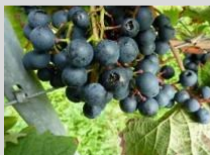
Abbildung 5: Verletzte Beeren sind attraktiv für die Kirschessigfliege zur Eiablage