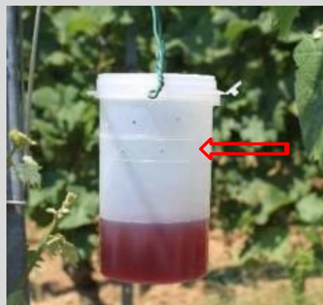
Abbildung 6: Befüllte Becherfalle mit Einflugbohrungen