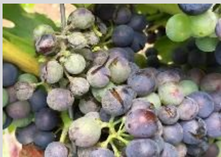
Abbildung 4: Oidium-geschädigt Trauben fördern einen Befall