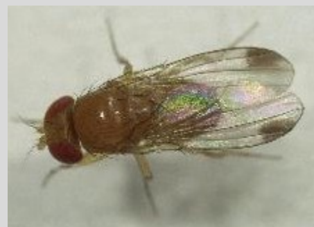
Abbildung 7: Männchen der Kirschessigfliege mit charakteristischen Flügelflecken