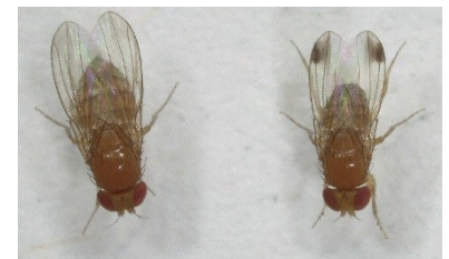
Abb. 1: Kirschessigfliegen; links: Weibchen, rechts: Männchen mit charakteristischen Flügelflecken

Die Kirschessigfliege Drosophila suzukii 🌐 ist 2011 erstmals in Deutschland detektiert worden und hat sich in den Folgejahren im gesamten Bundesgebiet etabliert, mit einem stärkeren Auftreten im süddeutschen Raum. Insbesondere Beerenobst, aber auch Weinbeeren von Tafel- und Keltertraubensorten werden befallen. 2014 ist der Schädling in großem Umfang in deutschen Weinbaugebieten aufgetreten und hat auch in den Folgejahren in Abhängigkeit von der Witterung und Lage sowie Sorte erhebliche Schäden verursacht.