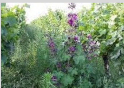
Abbildung 2: Hoher Bewuchs fördert Befall