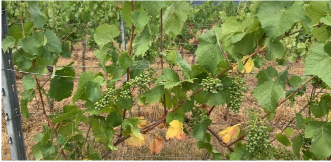
Abbildung 2: Trockengestresste Spätburgunderrebe vom 17.7.23; das Beeren- und Triebwachstum stagniert, basale Blätter vergilben und die Holzreife hat eingesetzt.

Tropfschläuchen sollten diese vorrangig nachts laufen. Regional bzw. zeitweise kann die Entnahme von Trinkwasser (Hydranten) oder aus öffentlichen Brunnen zu Bewässerungszwecken eingeschränkt oder untersagt werden. Die örtlichen Bestimmungen sind zu beachten. Eine Entnahme von Oberflächenwasser aus Bächen und Seen ist verboten. Ausnahmen sind spezielle Speicherbecken, die für extra diese Zwecke angelegt wurden.